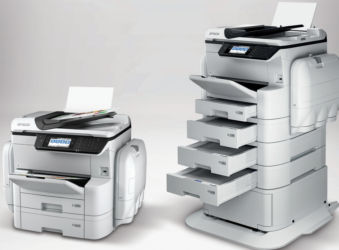
Bandejas de papel y soporte opcional.